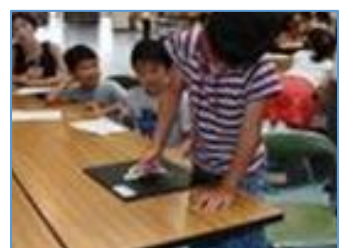
空気の重さを体験する実験