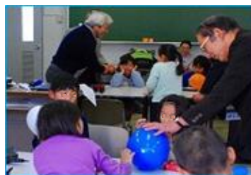
風船の空気を抜く実験